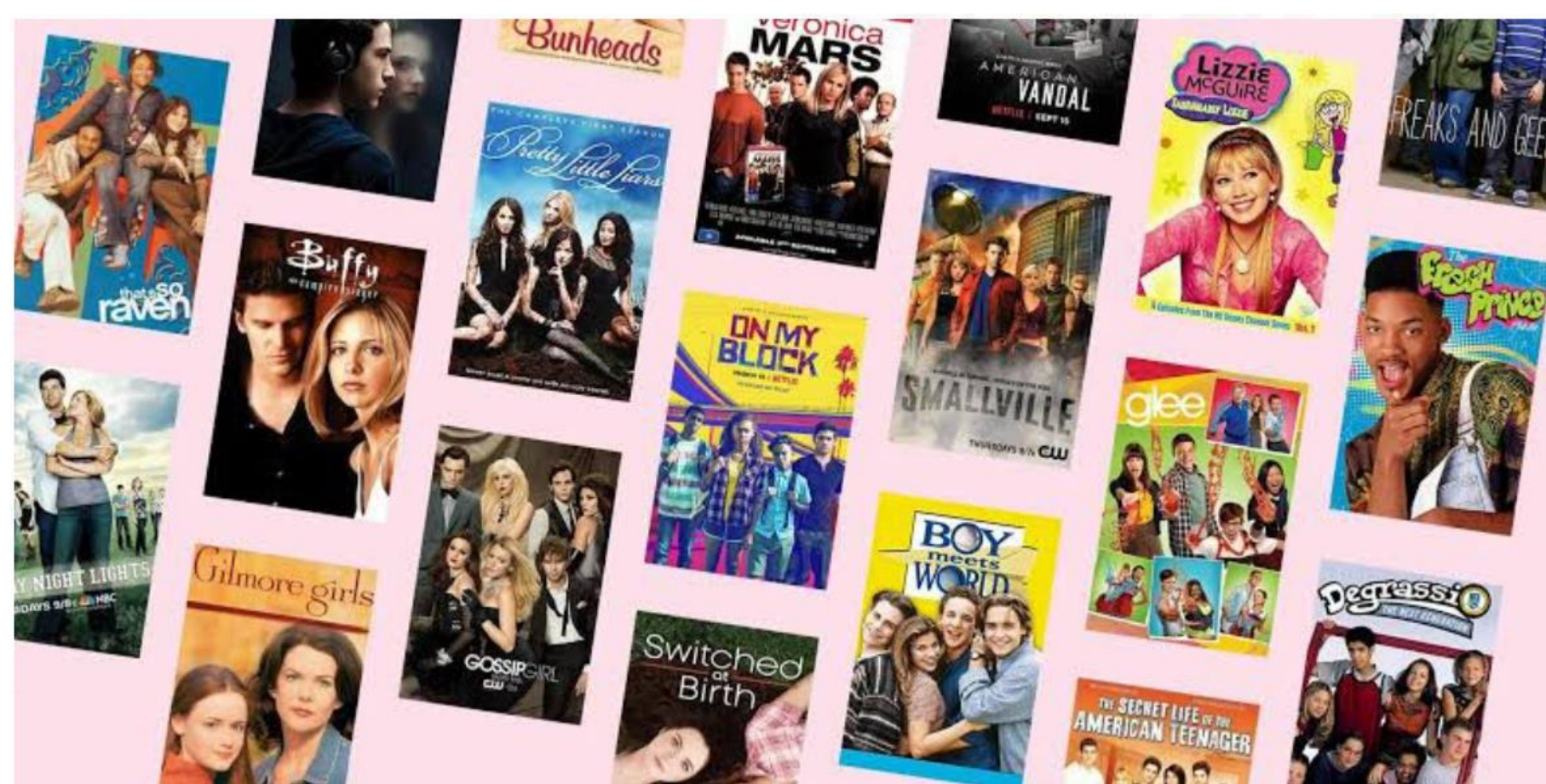
Figura 1 - Streamings